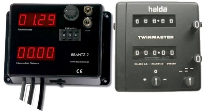
Elektronisk Brantz og mekanisk Halda tripteller.

Nå skal det legges til at dersom du har tenkt til å drive aktivt med Challenge, bør du i tillegg investere i en kalibrerbar tripteller i bilen. I flere løp kan du kjøre med 100-meters tripen i dashbordet, men du verden så mye mer moro det blir med enkalibrerbar tripp med større nøyaktighet!